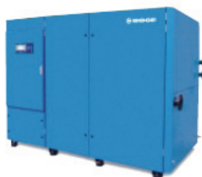
Brezoljni vijačni kompresor