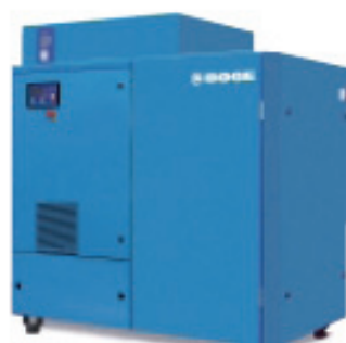
Vijačni kompresor z integrirano frekvenčno regulacijo motorja